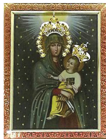
Cudowny obraz w kościele Matki Bożej Różańcowej w Lublinie

katolicy, szczególnie obecnie w tych trudnych czasach, gorąco modlą się do Matki Bożej Latyczowskiej, prosząc o pomoc i opiekę. Wspomnienie Matki Bożej Latyczowskiej, ustanowione przez Świętego Jana Pawła II, obchodzone jest 6 lipca.