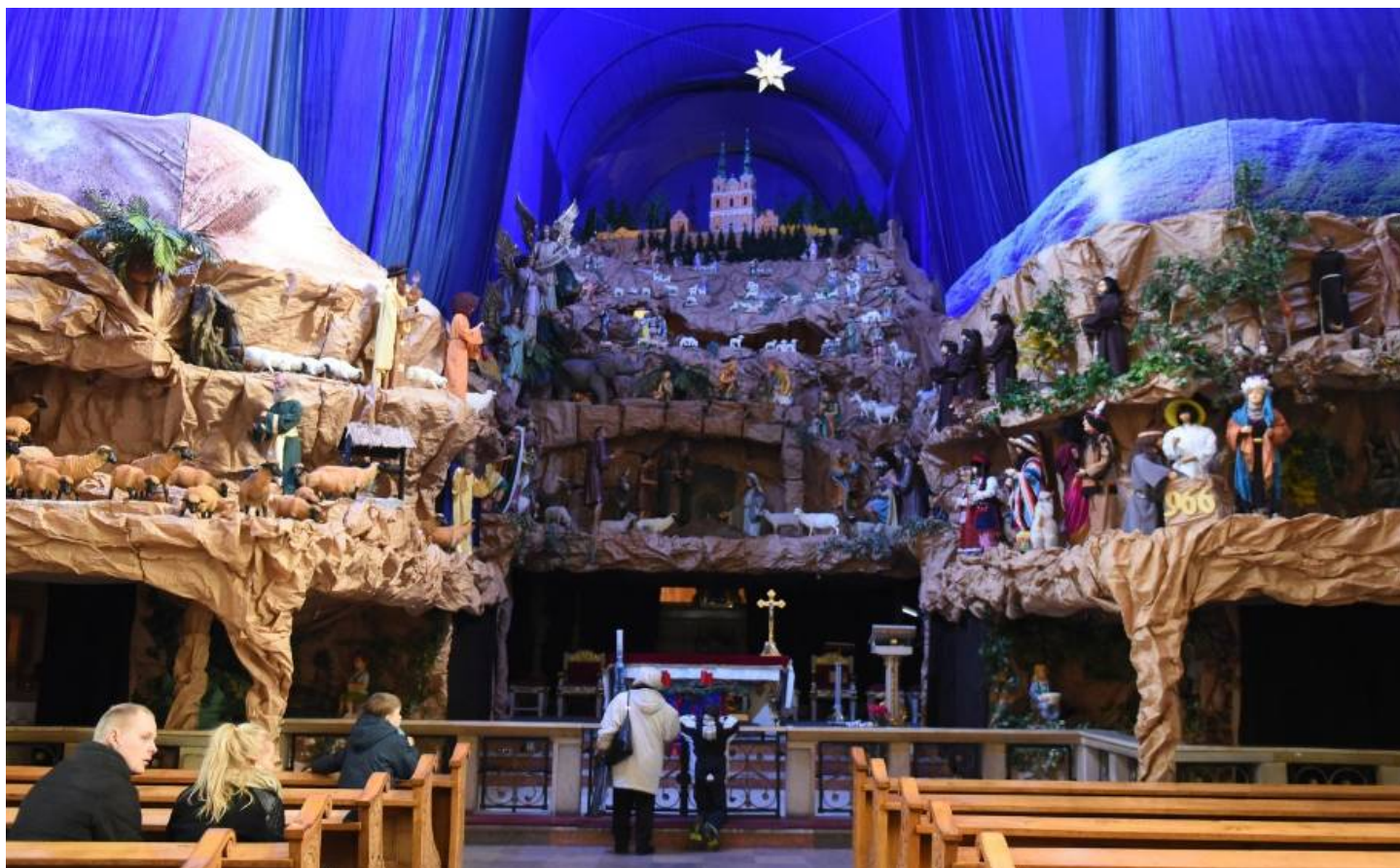
Szopka u Franciszkanów