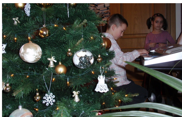
Wigilijne śpiewanie kolęd