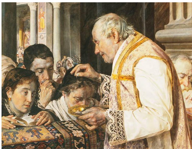
Posypanie Popiołem w XIX we Włoszech Julian Falat

Od wieków kalendarz liturgiczny Kościoła miał wpływ na kształtowanie tradycji świątecznych w naszym kraju. Podobnie jak w inne święta kościelne, tak również w Środę Popielcową kształtowały się ludowe obrzędy. Gdy o północy rozdzwaniały się dzwony kościelne, milkła muzyka, gasły wszędzie światła. W dawnej Polsce, gdy domowy zegar kończył wybijać godzinę dwunastą, pani domu wchodziła do jadalni z półmiskiem przykrytym pokrywą. Ucztujący obstępowali ją kołem, a gospodarz podnosił pokrywę, spod której „ulatywało ptaszę, najczęściej wróbel, mające symbolizować płochość”. Na półmisku zostawały śledzie, jajka i kubek mleka, główne potrawy kolacji zwanej podkurkiem. Popielec rozpoczyna długi okres postu, mający swoją szatę zewnętrzną - obrzędową. Tak jak zapusty musiały być wesołe, tak post miał być smutny, bo inaczej: „Zapust smutny, post wesoły - będziesz człeku przez rok goły”. Zgodnie ze starą tradycją, rano w środę, w karczmie u belki wieszano przetak z popiołem, a chłopiec usadowiony na przypiecku pociągał za sznurek i obsypywał popiołem każdego wchodzącego do karczmy.