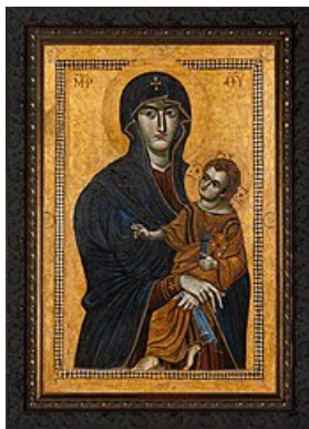
Obraz Matki Bożej Śnieżnej z bazyliki Santa Maria Maggiore w Rzymie