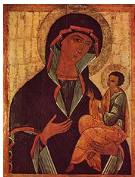
Hodegetria z Nowogrodu