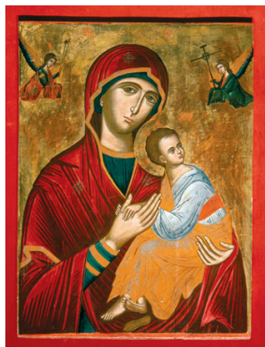
Matka Boża Hodegetria

Gwiazdy: (...) W Piśmie Świętym są stworzeniami, które radośnie wypełniają rozkazy Stwórcy: „Gwiazdy radośnie świecą na swoich strażnicach. Wezwał je. Odpowiedziały: „Jesteśmy”. Z radością świecą swemu Stwórcy” (...) Najjaśniej świeci wśród wybranych Maryja, Gwiazda Poranna, która poprzedza Chrystusa - Słońce i wydaje Go na świat. W Litanii loretańskiej wzywa się matkę bożą jako „Stella matutina”. Hymn wieczorny Ave maris stella pozdrowia Maryję w Jej święto jako Gwiazdę Morza, która wskazując drogę i niosąc otuchę, świeci nad falami świata. „Gwiazda na ramieniu Maryi jest symbolem tego, że Maryja jest dla każdego, kto się do niej ucieka „Gwiazdą przewodnią i ostatnim ratunkiem”.