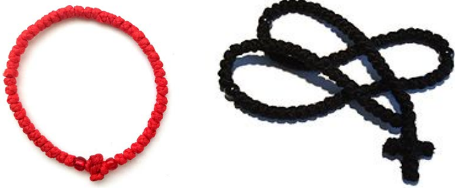
Czotki (pl) - komboskion (gr). 12/33/50/100/300/500 koralików albo węzełków nawet do 1000. w prawosławiu. Do odmawiania Modlitwy Jezusowej: Panie Jezu Chryste, Synu Boży, zlituj się nade mną, grzesznikiem.