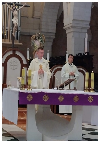
Msza w Kościele św. Katarzyny Aleks.

Ostatnią pielgrzymkową mszę św. mieliśmy w kościele św. Katarzyny Aleksandryjskiej gdzie modliliśmy się w intencji dzieci. Kościół ten przylega do Bazyliki Narodzenia i można z niego zejść do Groty Narodzenia. Przed kościołem na terenie odrestaurowanego wirydarza stoi kolumna a na niej św. Hieronim. Podczas tej mszy św. odnowiły swoje przyrzeczenia te małżeństwa, które nie mogły tego uczynić w Kanie Galilejskiej (patrz foto).