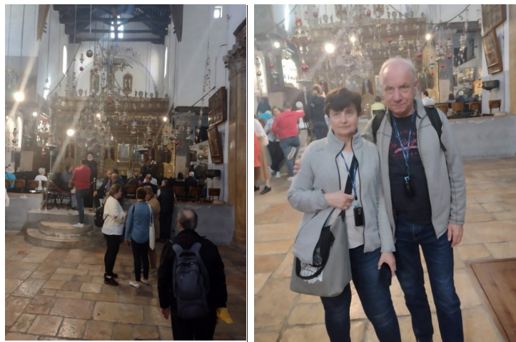
Wnętrze prawosławnej bazyliki nad Grotą Narodzenia