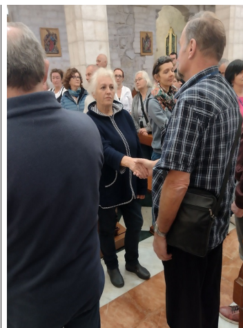
Odnowienie przyrzeczeń małżeńskich