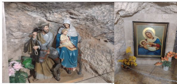
Wnętrze Groty Mlecznej