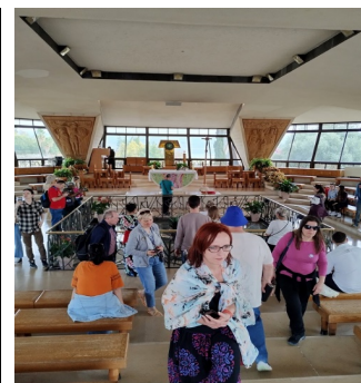
Kafarnaum kościół z zewnątrz i wewnątrz