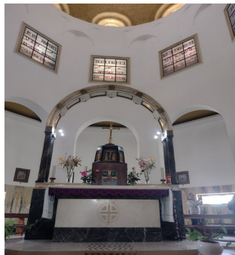
Kościół na G. Błogostawieństw