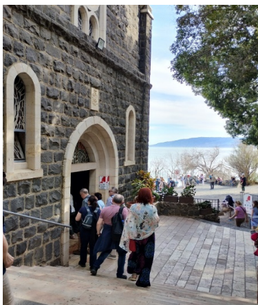
Kościół Prymatu św. Piotra z zewnątrz i wewnątrz