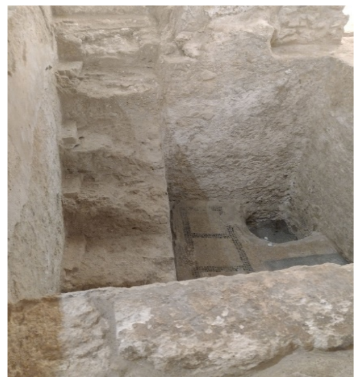
Basen do liturgii chrztu