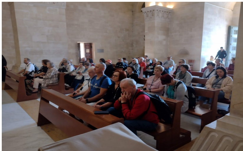
We wnętrzu Bazyliki Przemienienia Pańskiego