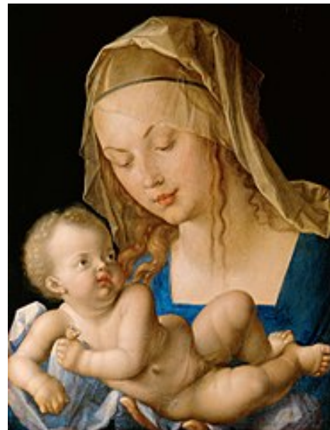
Madonna i Dzieciątko z gruszką

lem kobiecej wierności. Kolor tego kwiatu jest symbolem błękitnej szaty Bożej Rodzicielki. Jego angielska nazwa „Lady's Faith” oznacza w języku polskim Wiarę Najświętszej Maryi Panny.