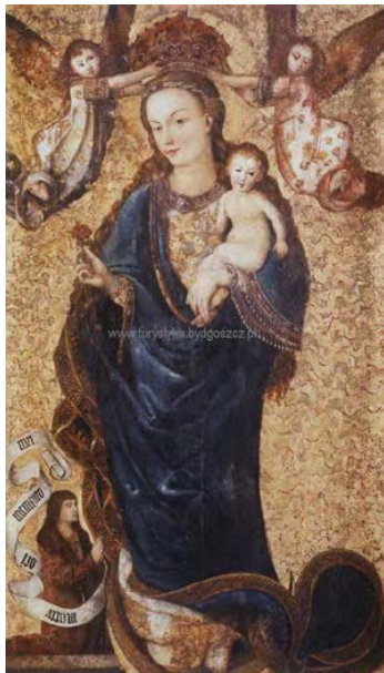
Madonna z różą

PRZETACZNIK OŻANKOWY - kwiat bardzo popularny na polskich łąkach jest symbo-