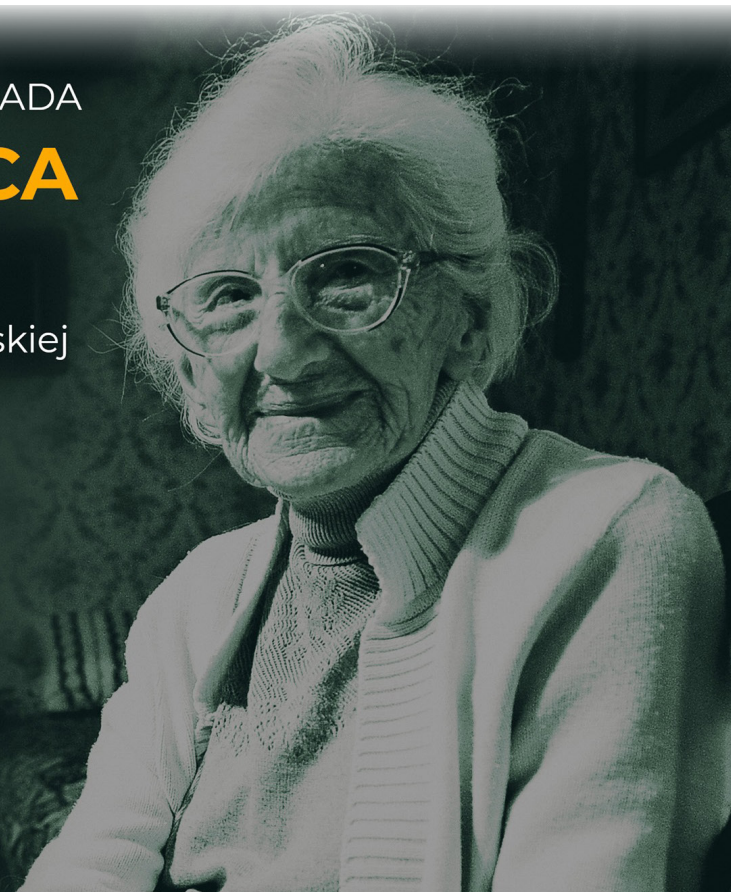
grafika kl. Michał Sulowski