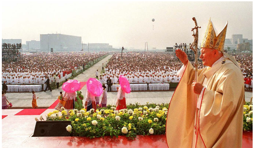
Manila, 1995 Hasło: Jak Ojciec mnie posłał, tak i Ja was posyłam (J 20, 21), 4 miliony uczestników

Początkowo obchody ŚDM, na szczeblu światowym, trwały zaledwie kilkanaście godzin i obejmowały wieczorne czuwanie modlitewne z Papieżem w sobotę oraz Mszę Św. pod jego przewodnictwem w niedzielny poranek. Młodzież gromadziła się przy krzyżu, ofiarowanym przez Jana Pawła II, któremu od 2003r. - z woli Papieża - towarzyszy kopia ikony Matki Bożej Salus Populi Romani (Ocalenie