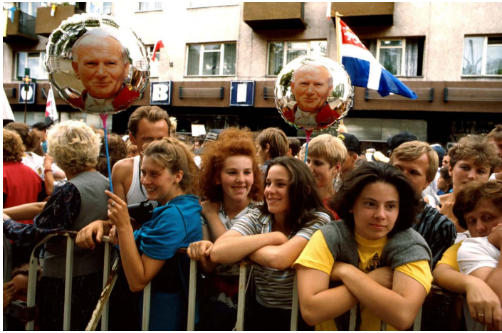
Częstochowa, 1991 Hasło: Otrzymałście Ducha przybrania za synów (Rz 8, 15), 1,6 miliona uczestników

ŚDM odbyły się trzykrotnie : najpierw w Kolonii w Niemczech (16-21 sierpnia 2005r.) z udziałem 1,2 mln osób, potem w Sydney w Australii (15-20 lipca 2008r.), na które przyjechało 400 tys. młodych katolików, i wreszcie w Madrycie w Hiszpanii (15-21 sierpnia 2011r.), gdzie było ich 1,5 mln. Dziennikarze i wierni zastanawiali się, czy Benedykt XVI będzie w stanie nawiązać podobny kontakt z młodzieżą, jak jego poprzednik. Choć Joseph Ratzinger nie posiadał poczucia humoru Karola Wojtyły, ujął wiernych swoją spokojną charyzmą. Po zakończeniu uroczystości w Kolonii komentatorzy religijni odetchnęli z ulgą - Światowe Dni Młodzieży nie były zagrożone.