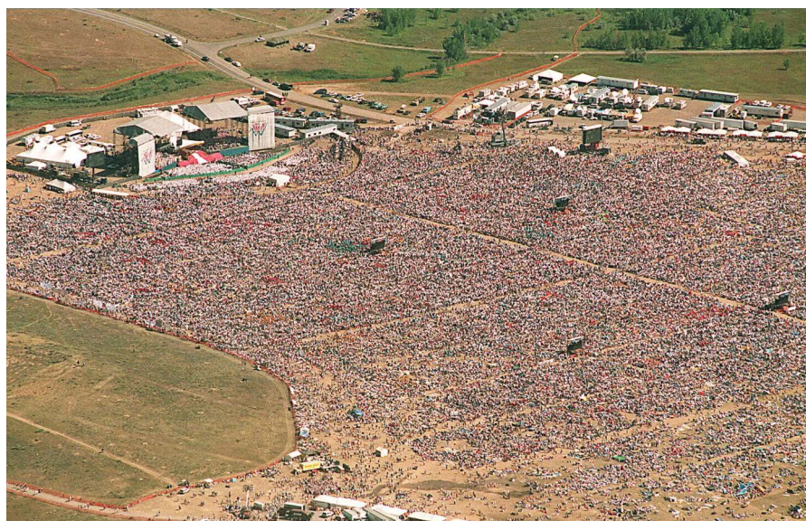
Denver, 1993 Hasło: Ja przyszedłem po to, aby (owce) miały życie i miały je w obfitości (J 10, 10), 700 tys. uczestników

Za pontyfikatu Franciszka obchody ŚDM miały do- tyczas miejsce m. in. w Rio de Janeiro w Brazylii (23-