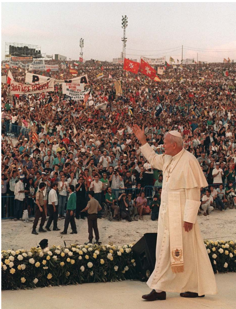
Santiago de Compostela, 1989 Hasło: Jam jest Droga i Prawdę, i Życiem (J 14, 6), 400 tys. uczestników

kolejną Niedzielę Palmową do Watykanu. Tydzień po tym spotkaniu, poruszony ich entuzjazmem, wyznał w orędziu wielkanocnym, że pragnie, „aby to wspaniałe przeżycie mogło powtórzyć się w przyszłych latach i dać początek Światowemu Dniowi Młodzieży w Niedzielę Palmową” . Miał on być obchodzony nie tylko w Rzymie, lecz także w całym Kościele katolickim, w każdej diecezji. Tak więc w Rzymie 23 marca 1986 roku, w Niedzielę Palmową, odbyły się pierwsze oficjalne Światowe Dni Młodzieży, których hasło stanowił fragment Pierwszego Listu św. Piotra Apostoła: „Pana zaś Chrystusa miejcie w sercach za Świętego i bądźcie zawsze gotowi do obrony wobec każdego, kto domaga się od was uzasadnienia tej nadziei, która w was jest” (1 P 3,15).