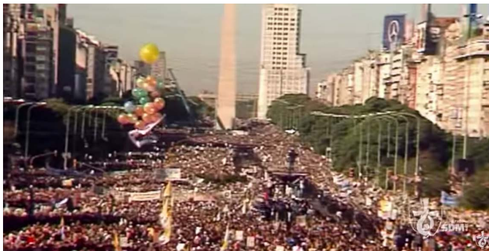
Buenos Aires, 1987

Hasło: Myśmy poznali i uwierzyli miłości, jaką Bóg ma ku nam (1 J 4, 16), ok. miliona uczestników