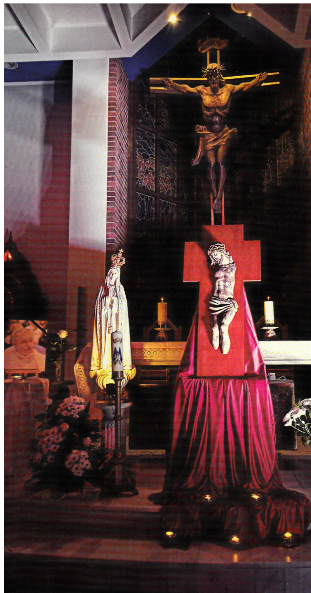
Moment na Adorację Krzyża w ciszy.

Nie są wolni od krzyża ani starzy, ani młodzi, ani zdrowi, ani chorzy, ani ubodzy, ani bogaci, ani prości, ani wykształceni, ani wierzący, ani niewierzący, ani ci, którzy wyznają wiarę w Jezusa Chrystusa, ani nawet ci, którzy zaprzeczają jego istnieniu. „Kto chce iść za mną, niech się zaprze samego siebie, niech weźmie krzyż swój i niech mnie naśladuje” (Mt, 16,24), niczego nie będzie trzeba dopowiadać. Życie stanie się wypełnieniem tych słów, a słowa te - dziś może mało zrozumiałe - nabiorą sensu. Na wielu drogach świata, na licznych ścieżkach twego życia staje skrzyżowany znak, który kiedyś miał kształt realniejszy niż rzeczywistość, który kiedyś był ciężarem na miarę kosmosu, który kiedyś spłynął żywą krwią ... i dlatego tutaj jesteśmy. Na początku wszystkich krzyży był ten jeden. Jego krzyż. Na początku wszystkich cierpień było to jedno. Jego cierpienie. Przyszliśmy, aby rozważyć cenę miłości.