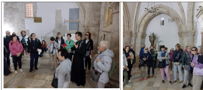
Wnętrze Sali na górze

Stamtąd udaliśmy się do budynku, gdzie w Sali na górze Jezus miał spożyć z uczniami Ostatnią Wieczerzę (patrz foto).