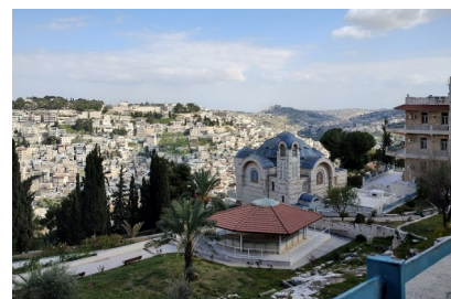
Kościół Zaparcia św. Piotra z zewnątrz i wewnątrz

Na obrzeżu Starej Jerozolimy znajduje się Kościół św. Piotra in Gallicantu (miejsce spiewu koguta czyli zaparcia się św. Piotra). Kościół wybudowano na miejscu groty, w której zgodnie z tradycją, Jezus spędził noc w oczekiwaniu na doprowadzenie przed sąd Piłata. Tutaj też zanim kogut zapiał św. Piotr trzykrotnie wyparł się Chrystusa.