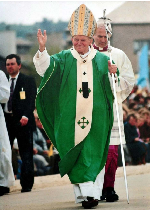
Jan Paweł II w Rzeszowie w 1991r.

lestwa niebieskiego. Są to ludzie - tacy jak każdy z nas - którzy tą drogą szli w ciągu swego ziemskiego życia i którzy doszli. Ludzie, którzy życie swoje budowali na skale, na opoce, jak to głosi psalm dzisiejszej liturgii: na skale, a nie na lotnym piasku (por. Ps 31[30], 3-4 ). Co jest tą skałą? Jest nią wola Ojca, która wyraża się w Starym i Nowym Przymierzu. Wyraża się w przykazaniach Dekalogu. Wyraża się w całej Ewangelii, zwłaszcza w Kazaniu na górze, w ośmiu błogosławieństwach.