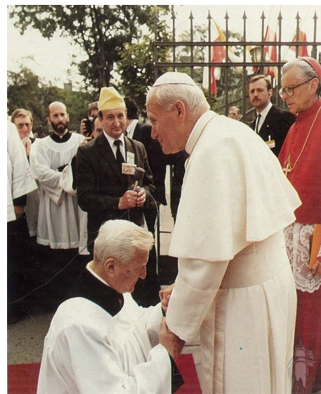
Jan Paweł II przy kościele Najświętszego Serca Jezusowego w Rzeszowie w 1991r.

Ostatni odcinek trasy, z kościoła NSJ na lądowisko na stadionie „Stali”, Papież pokonuje znów w pancерnej limuzynie. Dokładnie o godz. 16.42 papieska salonka, śmigłowiec Bell-412, odrywa się od murawy stadionu i bierze kurs na Przemyśl. Odlatujące śmigłowce żegnają tysiące rzeszowian. Rok po wizycie Papieża Rzeszów staje się stolicą nowej diecezji.