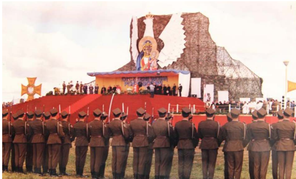
Spotkanie Jana Pawła II z żołnierzami w Zegrzu Pomorskim (archiwum diecezjalne)

„Święci i błogosławieni stanowią żywy argument na rzecz tej drogi, która wiedzie do kró-