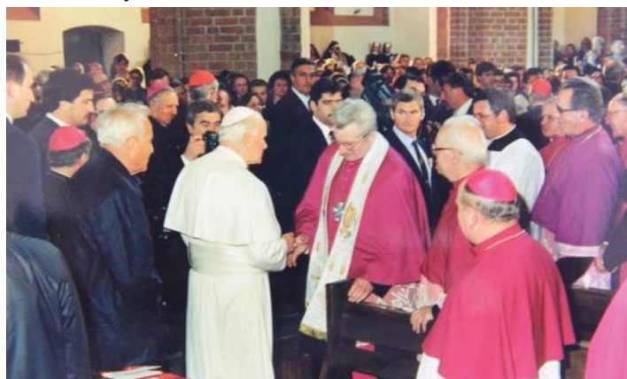
Koszalin, 1 czerwca 1991: Jan Paweł II w koszalińskiej katedrze (archiwum diecezji koszalińsko - kołobrzeskiej)

Ok. 18.45 św. Jan Paweł II przejechał ponownie do seminarium duchownego na kolację. Po niej, o 20.00, wyruszył na kolejne spotkanie, tym razem do koszalińskiej katedry. Tam o 20.30 przewodniczył nabożeństwu różańcowemu, transmitowanemu na cały świat przez Radio Watykańskie.