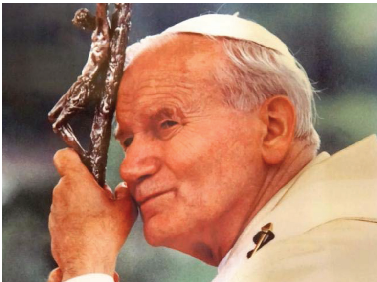
Jan Paweł II w Polsce w 1991r. (zdjęcie archiwalne)

Po obiedzie i krótkim odpoczynku Ojciec Święty ruszył w kierunku Góry Chełmskiej . Powitało go tam zgromadzenie oczekujące poświęcenia Sanktuarium Matki Bożej Trzykroć Przedziwnej . Ok. 15.15 rozpoczęła się ceremonia, której wtórował deszcz. Ten meteorologiczny akcent został wykorzystany przez Papieża w krótkiej przemowie. Oto jej fragment: