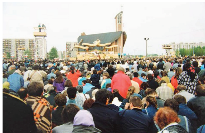
Msza Św. przed kościołem pw. Ducha Świętego w Koszalinie

Ok. 18.45 św. Jan Paweł II przejechał ponownie do seminarium duchownego na kolację. Po niej, o 20.00, wyruszył na kolejne spotkanie, tym razem do koszalińskiej katedry. Tam o 20.30 przewodniczył nabożeństwu różańcowemu, transmitowanemu na cały świat przez Radio Watykańskie.