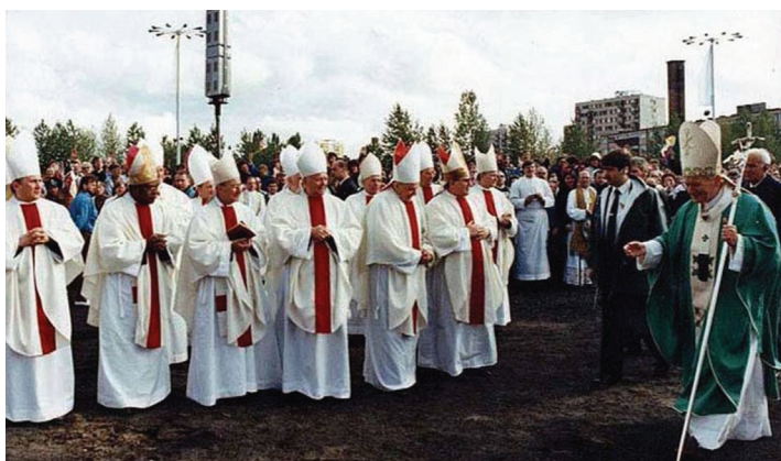
Msza Św. przed kościołem pw. Ducha Świętego w Koszalinie

„Słowa Twoje, Panie, są prawdą. Uświęć nas w prawdzie” (por. J 17,17).