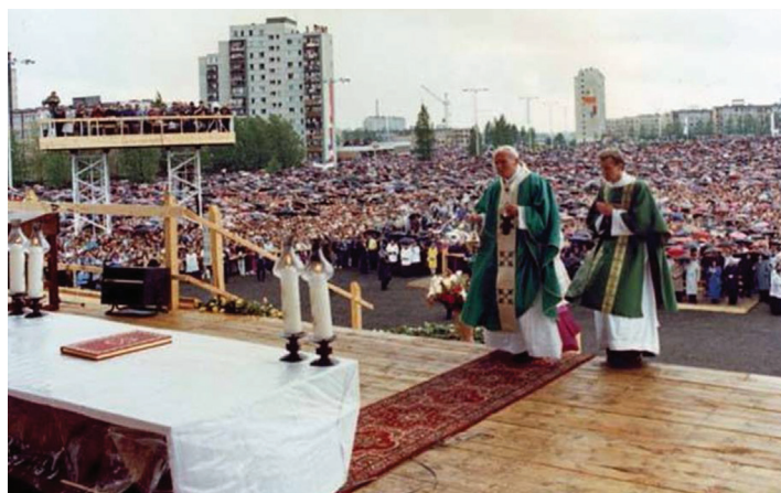
Msza Św. przed kościołem pw. Ducha Świętego w Koszalinie